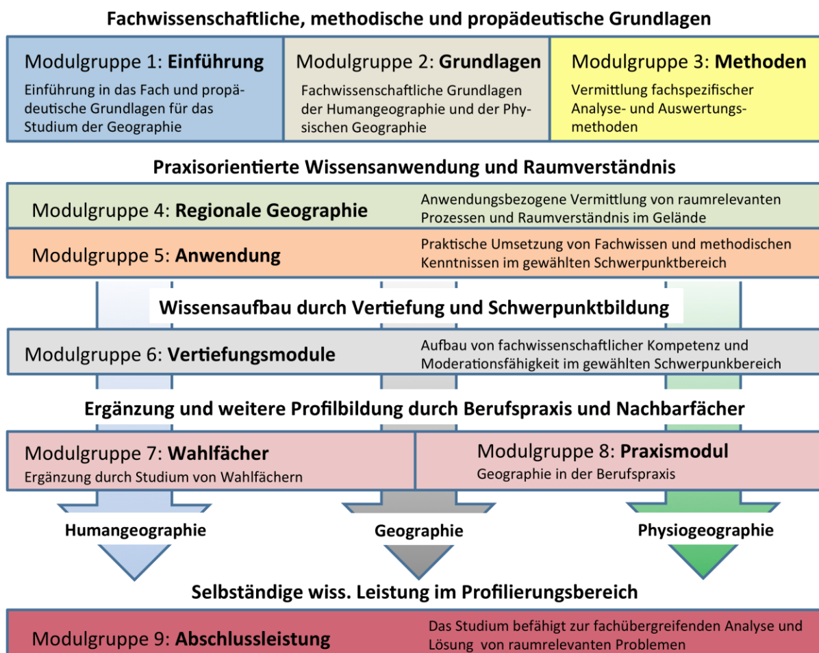
Abb. 1: Strukturdiagramm des Bachelor Geographie.

Ein Beginn ist zum Wintersemester empfohlen - bei einem Beginn im Sommersemester können Verzögerungen im Studium nicht ausgeschlossen werden.